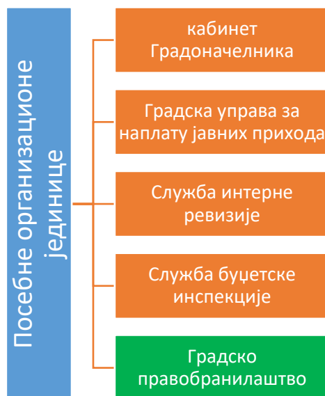
Dijagram 3: Posebne organizacione jedinice

U Gradskoj upravi kao posebni organi i organizacione jedinice funkcionišu: Kabinet gradonačelnika, Gradska uprava za naplatu javnih prihoda, Služba interne revizije, i Služba budžetske inspekcije Grada Novog Pazara (Dijagram 3).